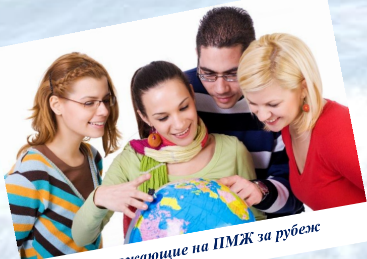
Выезжающие на ПМЖ за рубеж

Для обучающихся, по уважительным причинам (подтвержденным документально) не имеющих возможности пройти ОГЭ в основные и дополнительные сроки